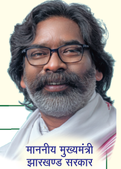
माननीय मुख्यमंत्री झारखण्ड सरकार