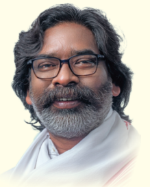
माननीय मुख्यमंत्री झारखण्ड सरकार

नोट : प्रखण्ड/अंचल कार्यालय द्वारा Voice Call या SMS के माध्यम से स्वीकृति की सूचना रजिस्टर्ड मोबाईल नं. पर दी जाएगी।